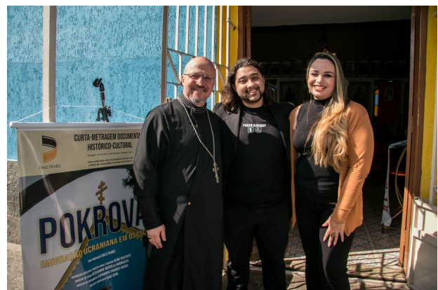
Atuando na pré-estreia do documentário POKROVA , realizada em 20 de julho de 2025, projeto contemplado pela Lei Paulo Gustavo (LPG).