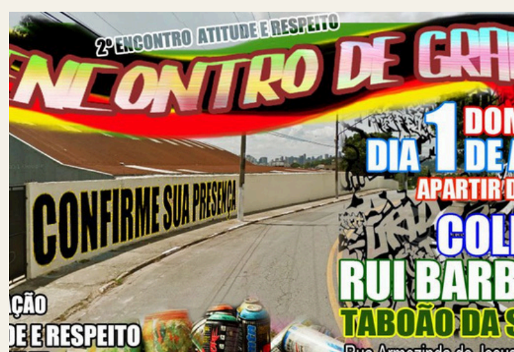
Encontro de Graffiti EMEF Ruy Barbosa (2012)