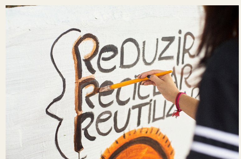
Oficina Tintas Ecológicas Projeto Hip Hop Ambiental