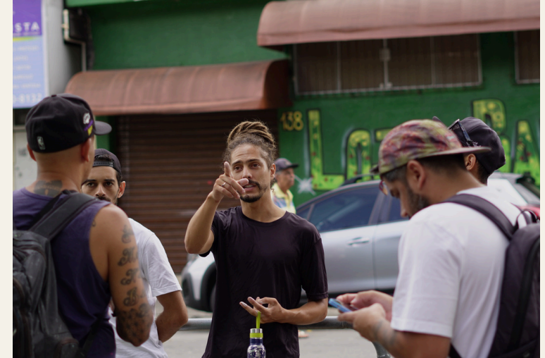
Encontro de Graffiti E.E. Lúcia de Castro Bueno 2025