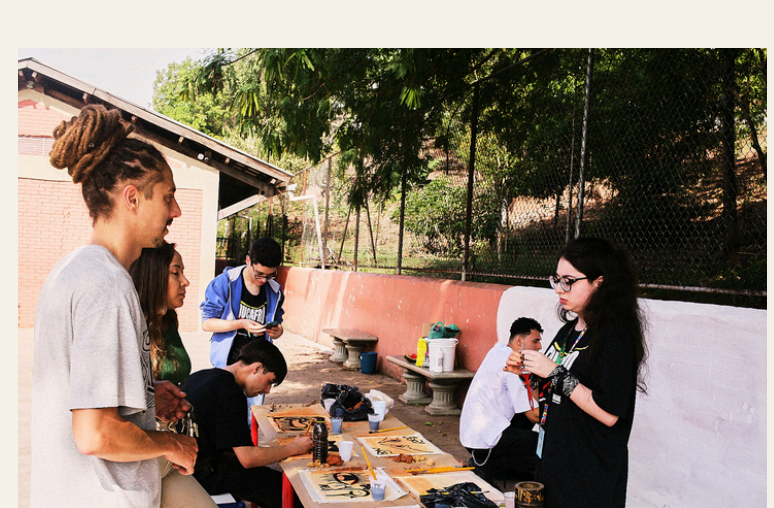
Oficina Tintas Ecológicas Projeto Hip Hop Ambiental