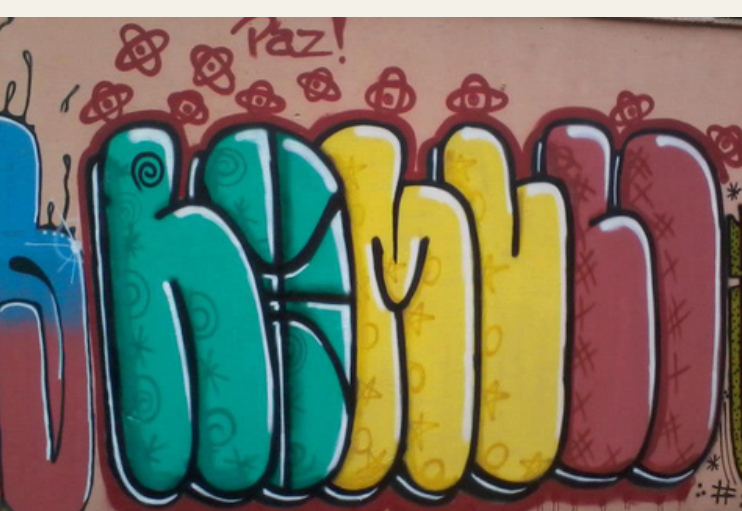
Encontro de Graffiti EMEF Dalva Barbosa (2013)