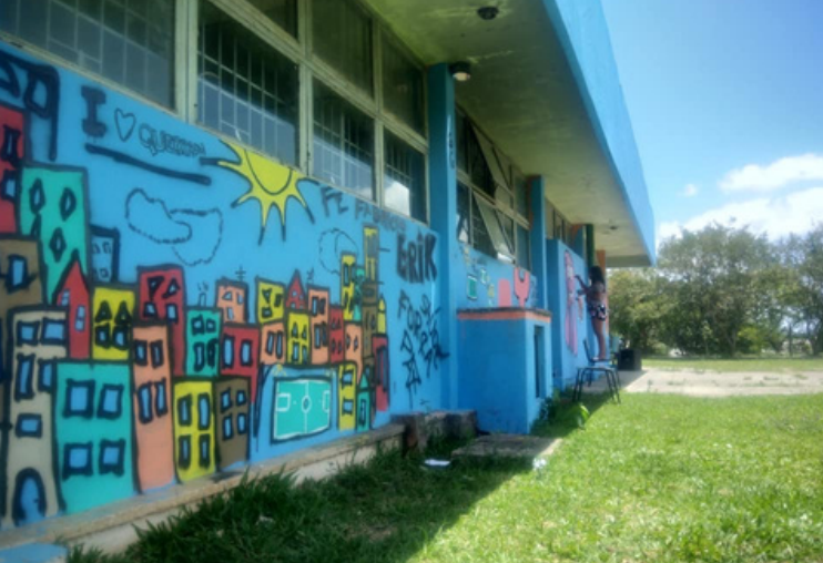
Oficinas de Graffiti CRAS Menino Jesus (2018)