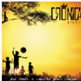
Até Onde o Coração Pode Chegar (2013)