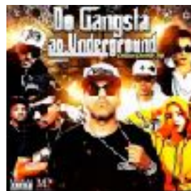
Do Gangsta ao Underground (2018)