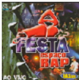
Festa do Espaço Rap (2009)