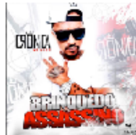
Brinquedo Assassino (2019)