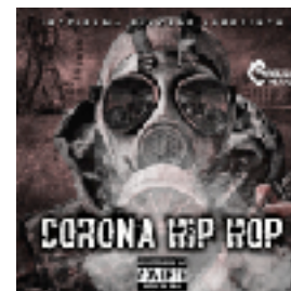
Corona Hip Hop (2020)