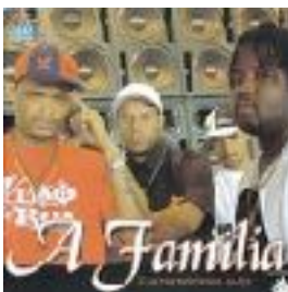
Cantando com a Alma (2004)