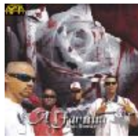
Mais Romântico (2008)