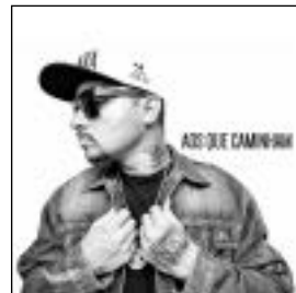
Aos que caminham (2018)