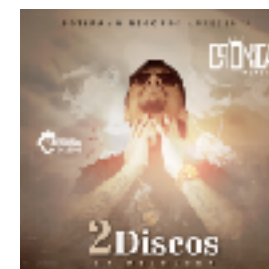
Dois discos (2020)